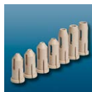
Końcówki do narzędzi (opcja) Do optymalnej i bezpiecznej obsługi narzędzi z węglików, szczególnie do małych średnic Clips for tools (optional) For safest and precise handling of high quality carbide tools - especially for smaller diameters