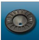
Dysk oporowy Stop disc

Nagrzewanie i chłodzenie w jednym miejscu. Heating and cooling in one station.