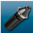
Wspornik na oprawki z szybkim mocowaniem bajonetowym Chuck support for tool holders with bayonet clamping