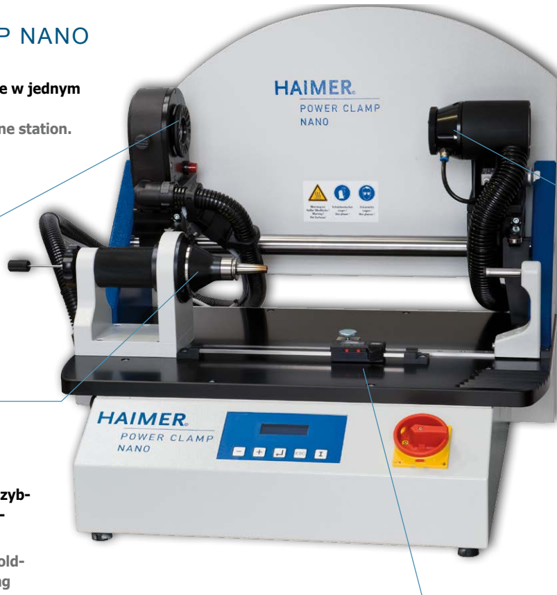
Ustawienie długości (opcja) Poziome ustawienie długości Tolerancja 0,05 mm Length presetting (optional) Horizontal length presetting unit Tolerance 0,05 mm